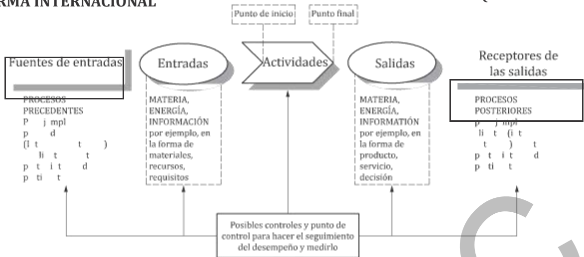
Figura 1 — Representación esquemática de los elementos de un proceso